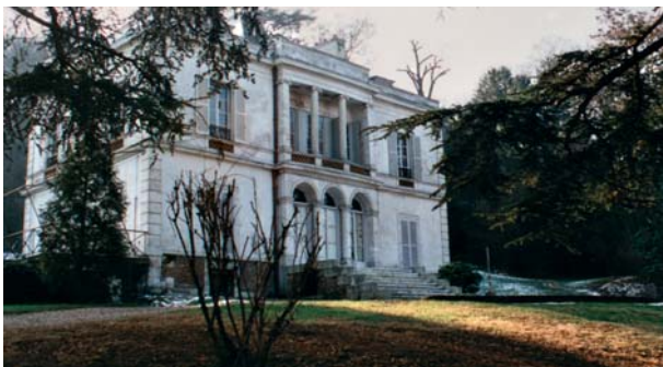
Villa de Pauline Viardot.

Il y aura aussi une évocation de ce qu'était Bougival à l'époque de Bizet. Une petite ville à la mode, où les gens riches et célèbres veulent avoir "une campagne", tels la "diva" Pauline Viardot et son ami Turguéniev.