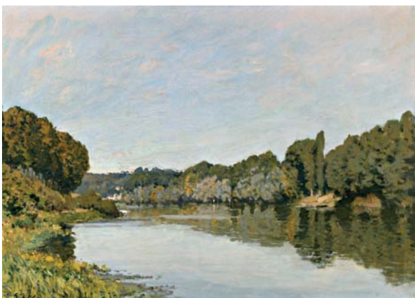
La Seine à Bougival, Sisley.

Durant ces mêmes années, Renoir, Monet, Pissarro, Sisley, précurseurs comme Bizet, élaborent sur ces bords de Seine, un nouveau langage pictural, l'Impressionnisme.